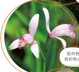
花の色がトキ(鳥)の羽の色に似たトキノウ