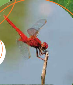
頭から脚まで全身真っ赤な ショウジョウトンボ