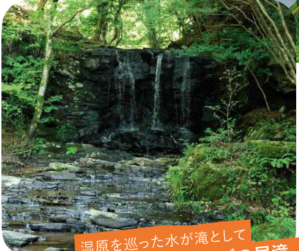
湿原を巡った水が滝として 流れ落ちるたびの尻滝

HP 黒沢湿原を守る会 http://kurozoumamoroukai.web.fc2.com/