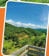
▲展望台からの眺望

HP 黒沢湿原を守る会 http://kurozoumamoroukai.web.fc2.com/