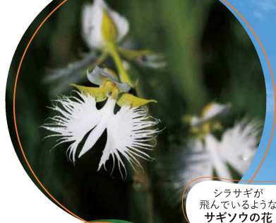
シラサギが飛んでいるような サギソウの花