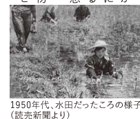
1950年代、水田だったころの様子

標高550mの山あいには広がっている湿地帯が黒沢湿原です。ここは1960年頃までは腰まで沈むほどの深い水田でした。古くから稲作が行われていたのです。かつて田んぼの畔に咲いていたサギソウをはじめとする多種多様な湿原植物が大変貴重であることが認められ、1965年に徳島県の天然記念物に指定されました。 絶滅危惧種の植物は単全体で約300種類ありますがそのうち約50種類は、黒沢湿原に生息しています。その中でもサギソウ、トキノウなど10数種類はここで見ることができません。植物だけでなくここは生き物たちにとっても大切な場所となっていて、県下に生息するトンボ約90種類のうち40数種類が黒沢湿原に生息しています。 ここでしか出会えない、めずらしい野花や生き物たちをこそ観察しに黒沢湿原を訪れてみませんか。