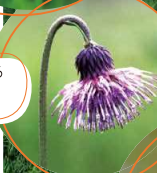
湿原の秋を彩る珍しい花 キセルアザミ