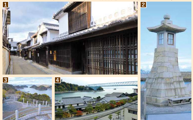
1 御手洗地区の町並み 2 高燈籠(大崎下島) 3 歴史の見える丘公園(大崎下島) 4 三之瀬地区の町並みと蒲刈大橋(下蒲刈島) ①広島県呉市の下蒲刈島～愛媛県今治市の岡村島②観光情報に関する問い合わせ:0823-23-7845 くれ観光情報プラザ(9:00～19:00)③安芸灘大橋有料道路・片道:軽自動車等570円、普通車730円

野呂山の南東沖に並ぶ島々を7つの橋で結ぶオーシャンロード。大崎下島の御手洗地区は、江戸時代から船が風待ち、潮待ちをする港町として栄え、現在も残る古い町並みは文化財保護法によって重要伝統的建造物群保存地区に選定されています。下蒲刈島の三之瀬地区は、かつて瀬の浦とともに瀬戸内海で2カ所あった海の関所の一つ。今でも御本陣跡などの史跡が残っています。