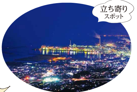
日本夜景遺産に認定された具定展望台からの夜景。

愛媛県四国中央市寒川町乙254-46◎約15台◎0896-28-6187 四国中央市観光交通課