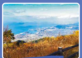
瀬戸内海から四国山地までの大パノラマを望む翠波峰