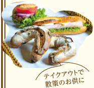
テイクアウトで散策のお供に

ログハウスの素敵なお店には自家製の天然酵母を使ったパンなどが50種類以上。開店当初から仕込んでいるサワー種を使ったバゲット・マカダミア(346円)や、梶原ジビエのメンチカツバーガー(540円)など。お求めは13時頃までに。