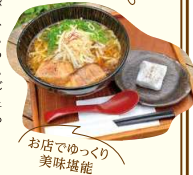
お店でゆづり美味堪能

焦がしニンニクの香りが食欲をそそる醤油ベースのラーメン(980円)。分厚い角煮は、とろとろの食感がたまりません。デザートに人気のほうじ茶スイーツ・満天の星大福が付いているのもポイント!