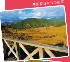
▼展望台からの眺望