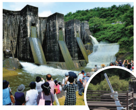
左岸側のアーチに「ゆる」を開閉するレバーを確認できます。

ため池の取水栓「ゆる」を開けて放流する行事。香川県内の主なため池では田植えが始まる6月に実施しますが、豊稔池の場合は「一滴の水も無駄にしたい」という地元農家の思いから、下流にある井関池の貯水量が3割を切る夏場に、向かって右端の洪水吐と左下の放水口のゆるを開けます。ごう音とともに毎秒4トンが放水される光景はまさに壮観。開催日は10~7日前にホームページでアナウンスされます。