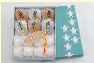
白色の皮には北海道の粒あん、茶色の皮には日和佐川の風味豊かな青のりあんがたっぷり。ウミガメの形が愛らしい。