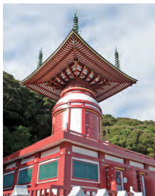
薬王寺の目印になっている朱色の瑜祇塔。天と地の和合を説く瑜祇経の教えに基づき建立