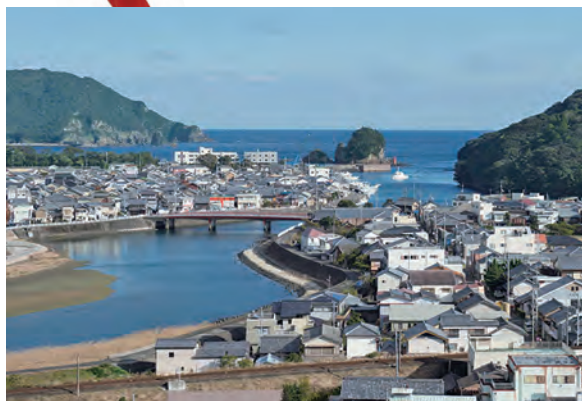
日和佐は日和佐川の河口に開けた町。黒潮が流れる良港な漁場があり、漁師町らしい古い町並みも見られる

港町として、薬王寺の門前町として歴史を刻んできた日和佐。高台にある薬王寺は、四国八十八ヶ所第23番札所であり、厄除けの寺として大勢の人が参拝に訪れる。ここには男女の厄年にちなんだ厄坂があり、石段の下に薬師本願経が二石二字に記して埋められ、二段ごとに賽銭を置きながら上ると厄が落ちるとされている。 仁王門をくぐると33段の女厄坂、続いて42段の男厄坂があり、最後は61段の還暦厄坂だ。到着した場所には瑜祇塔があり、そこから日和佐の町とウミガメが上陸する大浜海岸を一望できる。厄を落とし、美しい自然を目にして、心も体も洗われるかのようだ。