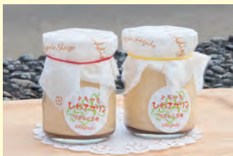
阿波和三盆糖を使い、上品な甘みとココ、とろけるような口当たりがたまらない。