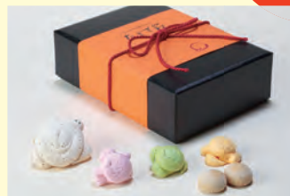
ココナッツ風味の海亀マカロンや和三盆糖味のカメラたまなど、ウミガメや卵をイメージしたお菓子の詰め合わせ。