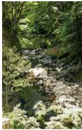
渓谷美も上勝の魅力だ。

徳島市から勝浦川に沿い県道16号を山側に行こう。町の起点になる「いっきゅう茶屋」からは美愁湖が見られる。さらにクルマを進めると細い町並みが現れる。棚田はさらに西に向かった山側だ。