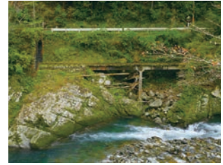
◎馬路村馬路382-1 まかいちよって家 ◎約2台 まかいちよって家 ◎芸西ICより車で約1時間 五味隧道 検索