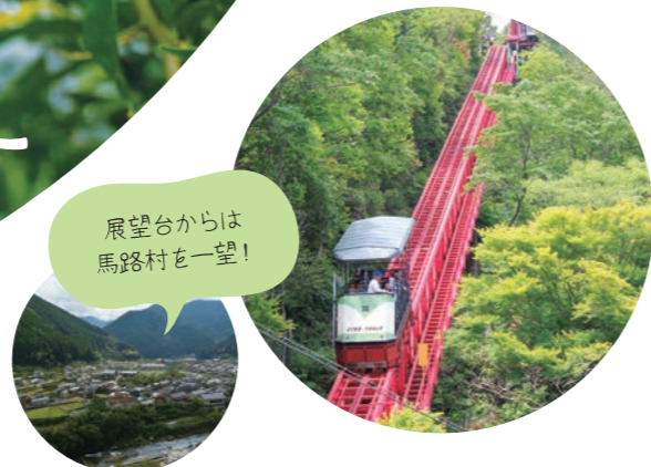
展望台からは馬路村を一望!