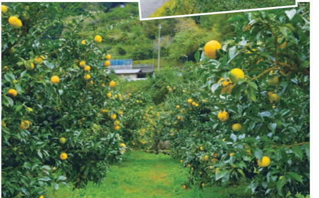
この道は「りんてつ」の軌道跡ゆず畑の中に続く「ゆずロード」

中芸地域の山間部を中心に、栽培面積約200ヘクタールものゆず畑が広がっています。初夏に小さな白い花を咲かせ、夏の盛りには緑色の果実と葉っぱが日差しに輝き、秋の訪れとともに果実が濃い黄色に色づいて爽やかな香りが辺り一帯に立ち込めます。収穫の時期には、収穫の安全祈願と初搾りを楽しむゆず祭りが行われ、中芸地域全体が活気づきます。