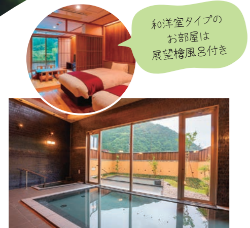
和洋室タイプのお部屋は展望檜風呂付き