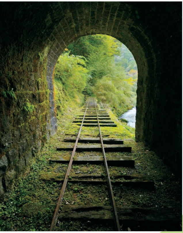
※特別な許可を得て撮影しています。