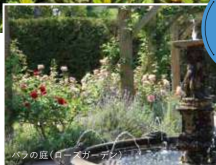
バラの庭(ローズガーデン)

玉野市制施行60周年記念事業の一つとして2000年、みやま公園内に開園。イギリス人庭園技師のピーター・サーマン氏が3ヶ月にわたって深山の自然を体感した上で設計を行った本格英国式庭園です。西洋庭園らしいシンメトリー(左右対称)な造形美の中に、イギリスならではの美的感覚を取り入れて作庭されています。 パピリオンを抜けると、花々の香りと18世紀のイギリスの運河をイメージして水生植物を配したカナルがお出迎え。四季折々の自然が調和した6つのゾーンへの旅が始まります。 噴水の水音が心地良い「ウォーターガーデン」、四季咲きのバラが美しく香る「ローズガーデン」、夏の花々を集めた「サマーフラワーガーデン」…。1年を通して順番に見頃を迎えるように考えられており、植物たちがバトンタッチをするように季節ごとの香りを届けてくれます。 中でも毎年楽しみにしている人が多いのが、30種180株が競い合うように咲く初夏のバラ。ローズガーデンでは噴水の音が少し大きめに設計されており、色とりどりの