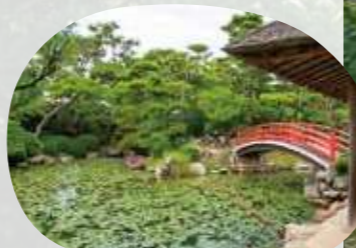
松と水蓮の緑に朱色の橋が映えます。

新元号・令和を記念し設置。稲荷社は京都・伏見稲荷大社から勧請したもの。撮影スポットとしても人気。